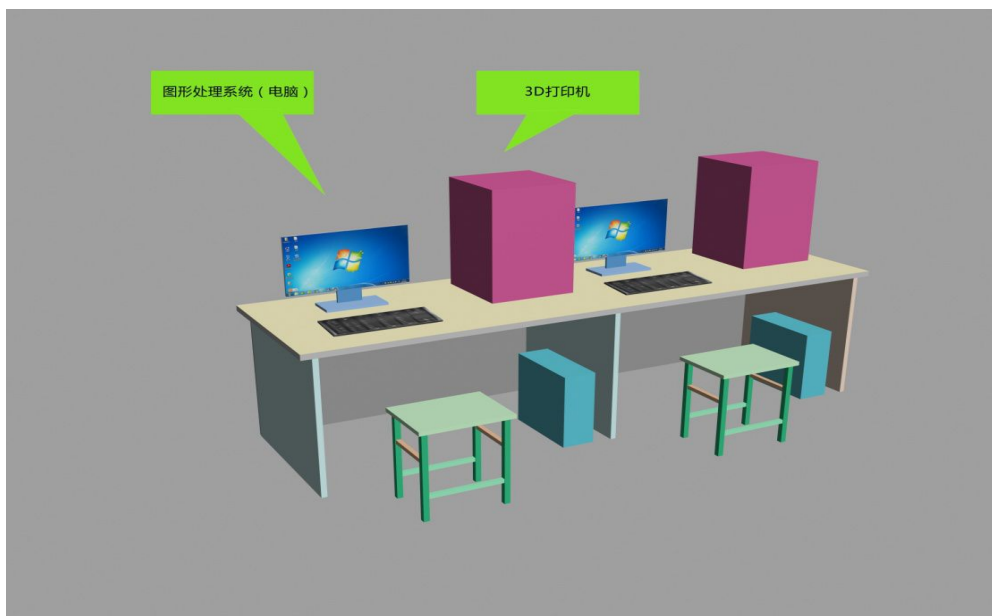
图 6 技术平台示意图