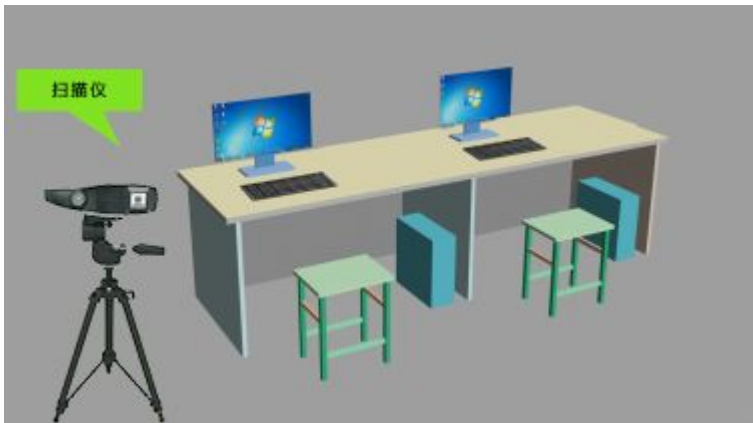
图 3 学生组技术平台示意图