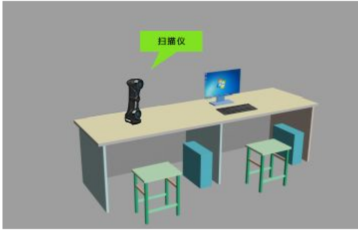
图 5 职工组技术平台示意图