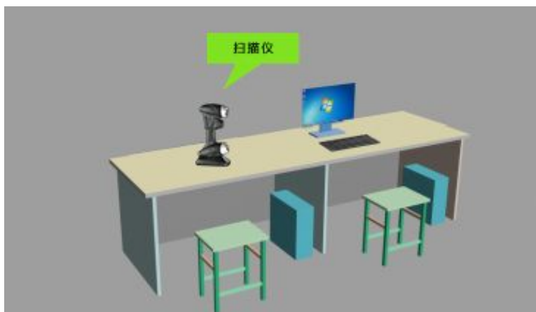
图 4 教师组技术平台示意图