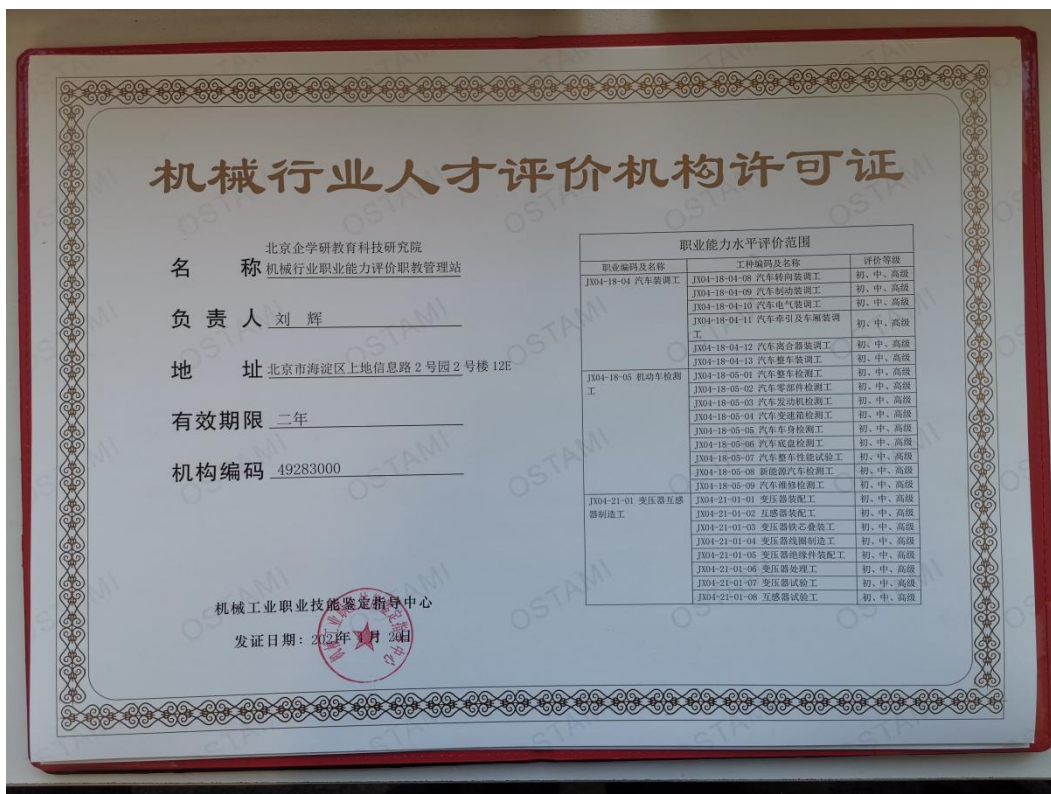
机械行业人才评价机构许可证